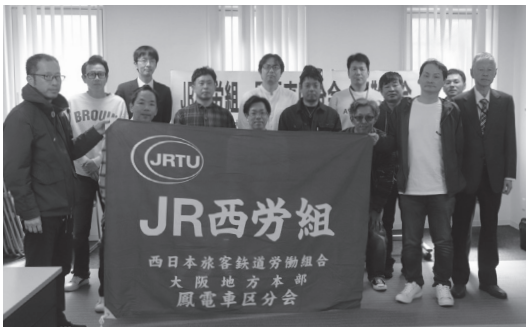
鳳電車区分会の皆さん