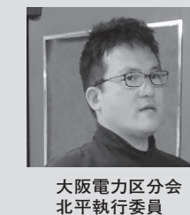
大阪電力区分会 北平執行委員