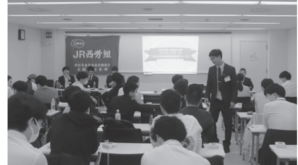
アイスブレイクで打ち解け合う参加者の皆さん

らは、労働組合の基礎知識や他労組との違い、JR西労組の役割、組織、世話役活動、組合費等について説明があった。