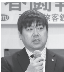
春闘結果を報告する 中央本部大川組織・国際部長