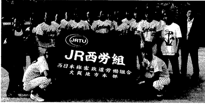
優勝した京橋車掌区分会

またこの大会に御協力いただいた支部・分会の役員、グラウンド整備等していただいた選手の皆様、また応援に駆け付けて頂いた皆様に感謝を申し上げます。 謝を申し上げると共に、京橋車掌区の中央本部野球大会での優勝を祈念いたします。